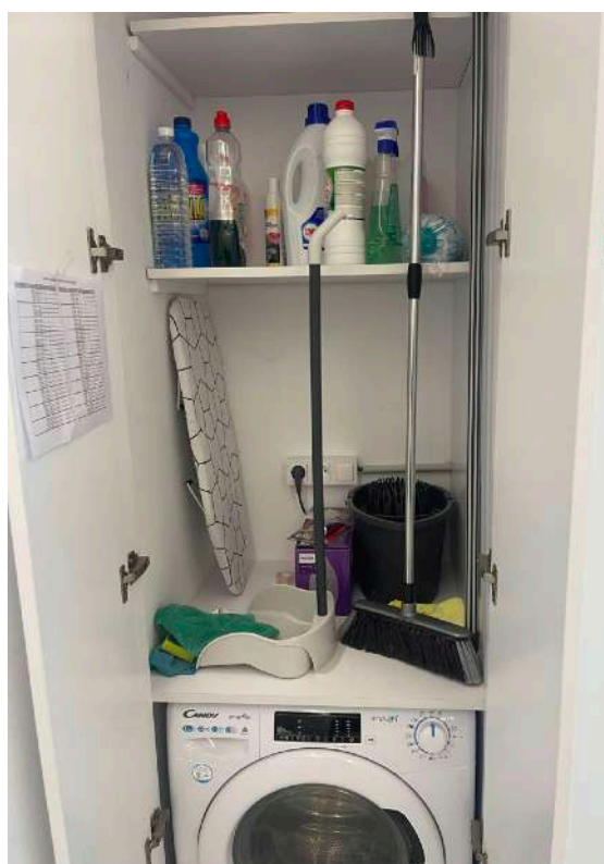
Reserva de lavadora Washing machine booking