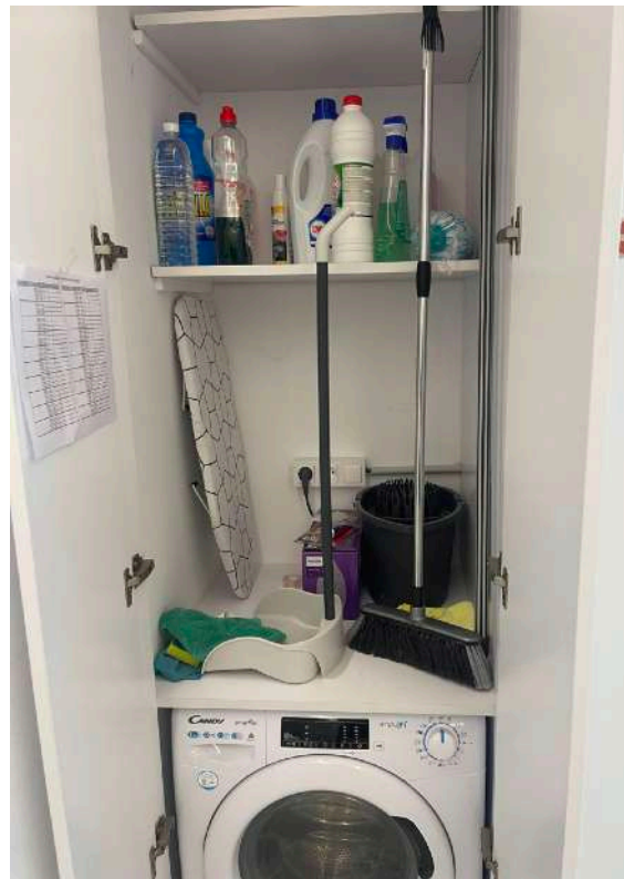
Reserva de lavadora Washing machine booking